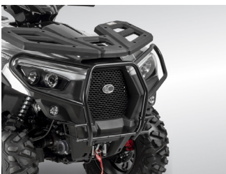
BUMPER NOIR MAT KA-01-0628

Tarif TTC incluant : MXU 550i EPS à 7 999 € + frais de mise à la route, de transport, de préparation et de mise à disposition du véhicule