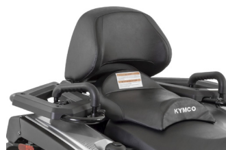
KIT CONFORT PASSAGER KA-01-0639