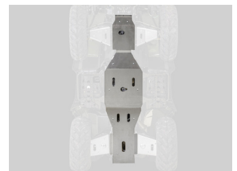
PROTECTION CENTRALE (AVANT ET ARRIERE) KA-01-0363

Prix TTC public conseillé pour la France hors accessoires éventuels. Données techniques et photos non contractuelles.