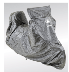
HOUSSE SCOOTER PM KYMCO POLYESTER IMPERMEABLE KA-01-0468

Pour les trajets courts, privilégiez la marche ou le vélo #SeDéplacerMoinsPolluer.