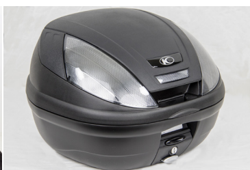
TOP CASE KYMCO NOIR 39L KA-01-0438