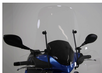
PARE BRISE HAUT KA-01-0132