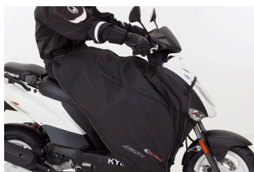
TABLIER DOUBLE 8 KA-01-0298