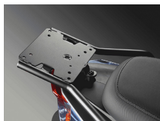
SUPPORT TOP CASE KA-01-0288