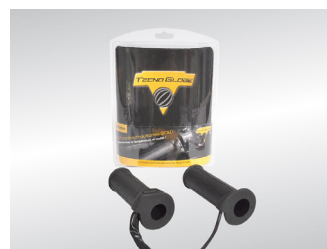
POIGNEES CHAUFFANTES KA-01-0444