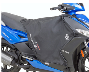
TABLIER DOUBLE 8 KA-01-0369

Tarif TTC incluant : AGILITY 50 16+ à 2 499 € + frais de mise à la route, de transport, de préparation et de mise à disposition du véhicule