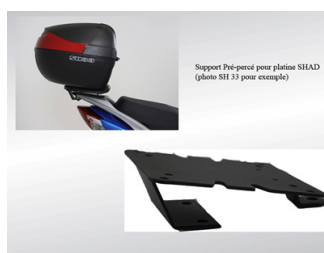
SUPPORT TOP CASE KA-01-0358