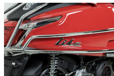
BARRES LATERALES ARRIERES CHROME KA-01-0493

Pour les trajets courts, privilégiez la marche ou le vélo #SeDéplacerMoinsPolluer.