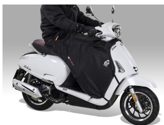
TABLIER DOUBLE 8 KA-01-0499

Tarif TTC incluant : LIKE 50 à 2 699 € + frais de mise à la route, de transport, de préparation et de mise à disposition du véhicule