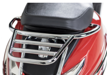
SUPPORT DE TOP-CASE KA-01-0617