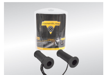
POIGNEES CHAUFFANTES KA-01-0444

Pour les trajets courts, privilégiez la marche ou le vélo #SeDéplacerMoinsPolluer.