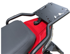
SUPPORT DE TOP CASE SUPER 8R KA-01-0690

Tarif TTC incluant : SUPER 8 à 2 699 € + frais de mise à la route, de transport, de préparation et de mise à disposition du véhicule