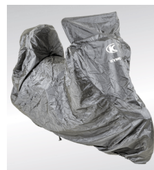
HOUSSE SCOOTER PM KYMCO POLYESTER IMPERMEABLE KA-01-0468