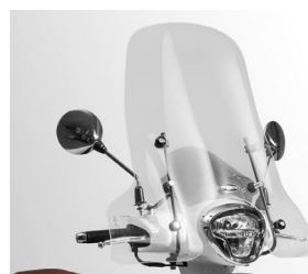
PARE BRISE HAUT KA-01-0490