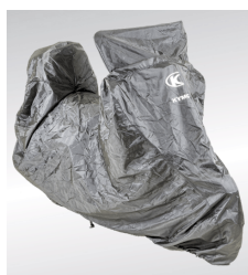
HOUSSE SCOOTER IMPERMEABLE KA-01-0469