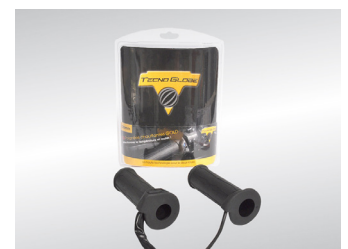
POIGNEES CHAUFFANTES KA-01-0444

Pour les trajets courts, privilégiez la marche ou le vélo #SeDéplacerMoinsPolluer.