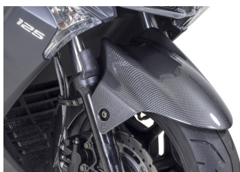
GARDE BOUE AVANT CARBONE KA-01-0247

Tarif TTC incluant : X.TOWN 125i à 4 299 € + frais de mise à la route, de transport, de préparation et de mise à disposition du véhicule