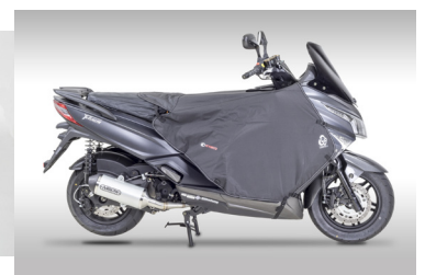
TABLIER DOOBLE 8 KA-01-0407

Pour les trajets courts, privilégiez la marche ou le vélo #SeDéplacerMoinsPolluer.