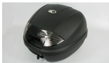
TOP CASE KYMCO NOIR 30L KA-01-0418