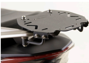
SUPPORT DE TOP CASE X-TOWN CT 125 KA-01-0660

Tarif TTC incluant : X.TOWN CITY 125 à 4 399 € + frais de mise à la route, de transport, de préparation et de mise à disposition du véhicule