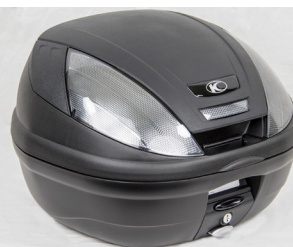
TOP CASE 39L KYMCO NOIR