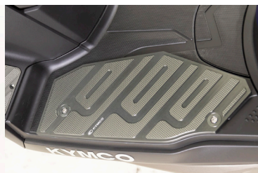
MARCHE PIED ALUMINIUM X-TOWN CT 125 KA-01-0659