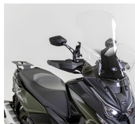
PARE BRISÉ GT DT-X360 KA-01-0588