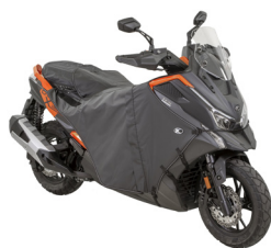
TABLIER DE PROTECTION ETANCHE DOUBLE 8 DTX-360 KA-01-0597