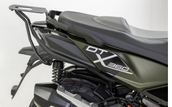
SUPPORT DE TOP CASE ACIER DT-X360 KA-01-0587

Pour les trajets courts, privilégiez la marche ou le vélo #SeDéplacerMoinsPolluer.