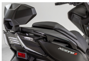
DOSSERET PASSAGER ALUMINIUM NOIR KA-01-0624