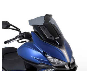
PARE BRISÉ SPORT NOIR X-CITING S 400 KA-01-0640