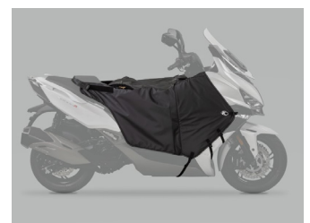
TABLIER DOOBLE 8 KA-01-0652

Pour les trajets courts, privilégiez la marche ou le vélo #SeDéplacerMoinsPolluer.