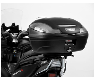
TOP CASE KYMCO NOIR 47L KA-01-0650

Tarif TTC incluant : XCITING S400I à 6 999 € + frais de mise à la route, de transport, de préparation et de mise à disposition du véhicule