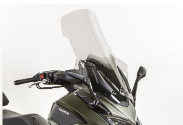
Pare brise GT KA-01-0693