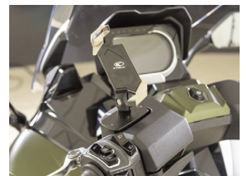
Support de téléphone KYMCO KA-01-0583

Pour les trajets courts, privilégiez la marche ou le vélo #SeDéplacerMoinsPolluer.