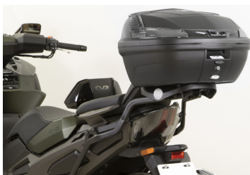
TOP CASE KYMCO NOIR 47L KA-01-0695

Tarif TTC incluant : CV3 à 12 999 € + frais de mise à la route, de transport, de préparation et de mise à disposition du véhicule