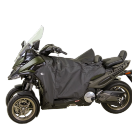
TABLIER DE PROTECTION ETANCHE KA-01-0598