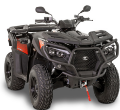
BUMPER AVANT NOIR Pour MXU 550 / 700 A PARTIR DE 2019 KA-01-0554

Tarif TTC incluant : MXU 550i à 7 499 € + frais de mise à la route, de transport, de préparation et de mise à disposition du véhicule