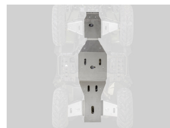
SET COMPLET DE PROTECTION ALU MXU 550 ET 700 A PARTIR DE 2019 KA-01-0556