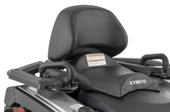
KIT CONFORT PASSAGER KA-01-0639